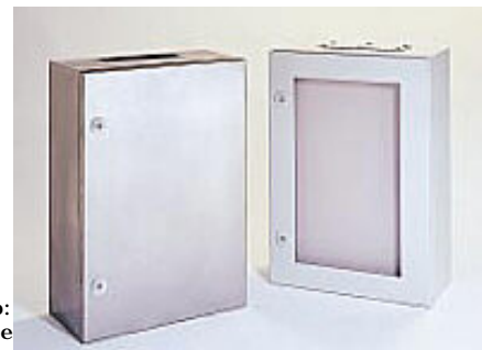
Quadri in metallo: acciaio inox (AI) e metallo 15/10 verniciato con resina epossidica (MV);

Proposti in 6 differenti involucri i quadri della Serie EASYBOX sono caratterizzati da una serie di accessori comuni a tutte le realizzazioni, facili da assemblare e rispondenti alle molteplici esigenze impiantistiche.