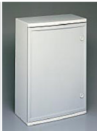
Quadro LT tipo 4 (460x670x245mm) portella grigia cieca