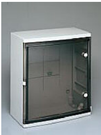
Quadro LT tipo 3 (460x520x245mm) portella trasparente fumè

La Serie EASYBOX ideata da SCAME è in grado di offrire, con pochi elementi modulari, differenti varianti installative.