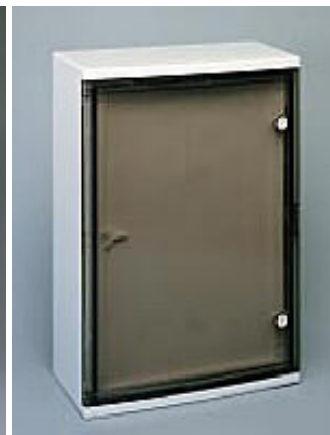
Quadro LT tipo 3 (460x520x245mm) portella trasparente fumè