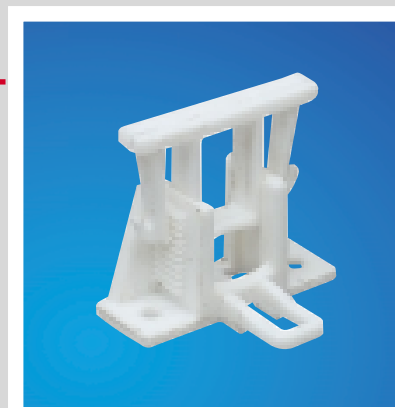
■ FC - Tutte le scatole porta apparecchi che sono idonee alle colonne BIS sono dotate di morsetti fermacavi che si montano sulle apposite guide di fissaggio sui 4 lati del fondo delle scatole.