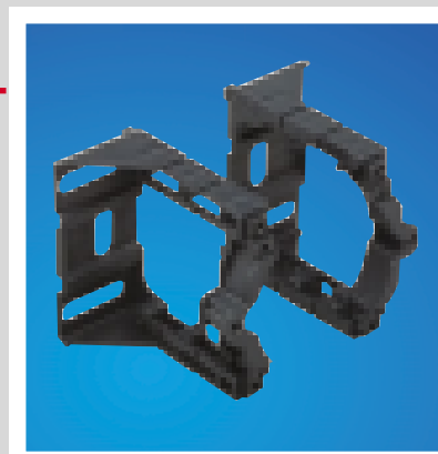
■ SA-MN - Il supporto porta apparecchi modulare ad interasse variabile è ideale per utilizzare al massimo lo spazio interno della colonna per il passaggio dei cavi.