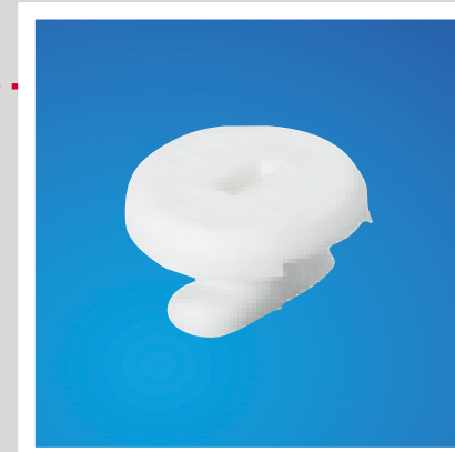
■ ZP1 - Il fissaggio di tutte le scatole porta apparecchi SAN-3, SAN-6 e SA-MN si effettua all'interno delle colonne con l'utilizzo dell'elemento di fissaggio ZP1, come per tutti gli accessori Bocchiotti.